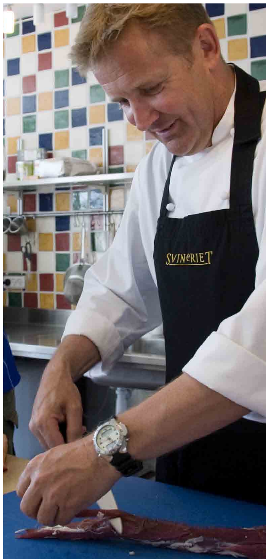
Opskrifterne i denne pjeces er udarbejdet af Claus Udengaard

»Selvfølgelig bliver kødet fra den forreste del ikke så mørt som fileten. Men det er tilstrækkelig mørt til, at du kan servere det som steg. Jeg tror, det har noget at gøre med både dyrelælden, foderet og alderen«, siger han.